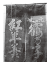
( 霧の子と紅羊羹の暖簾 )