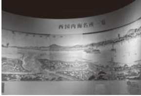
西国内海名所一覧

年貢米が集められて、ここから船で運ばれたから。 地方の特産品などが集められ、船で江戸に運ばれたから。