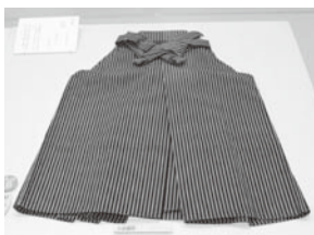
( 小倉織の袴 )

参勤交代のときの大名の宿所としても栄えた小倉には、江戸時代に全国的にも有名だった特産品が多数ありました。下の写真の特産品を探してみよう。