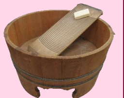
たらいと洗たく板