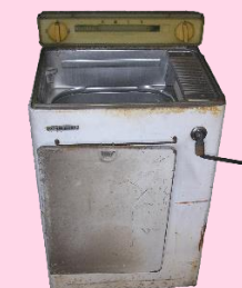
ローラー式洗濯機