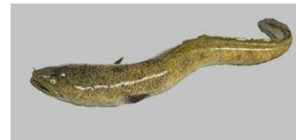
オオウナギのはく製